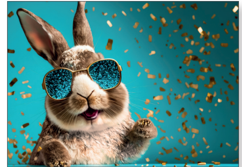
216604 Glitzer Hase