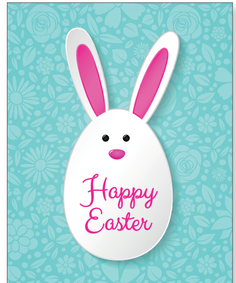
211024 Lustige Ostern