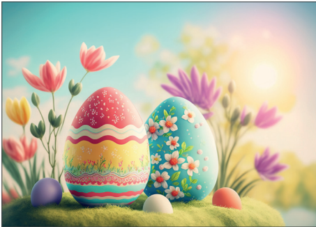
216600 Floral Easter Eggs