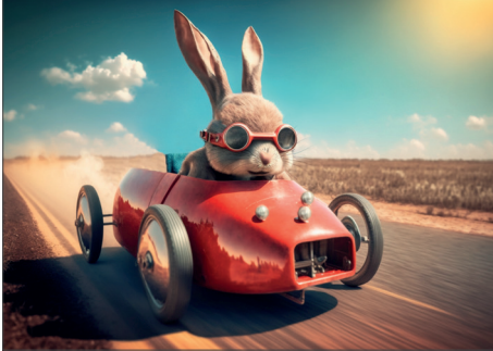
216603 Race Bunny

HIER FINDEST DU EINE GROSSE AUSWAHL AN MOTIVEN. VIELE MOTIVE PASSEN AUCH FÜR DIE UNTERSCHIEDLICHSTEN FORMATE.