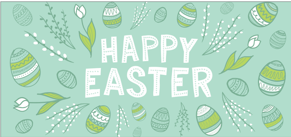
211027 Happy Easter