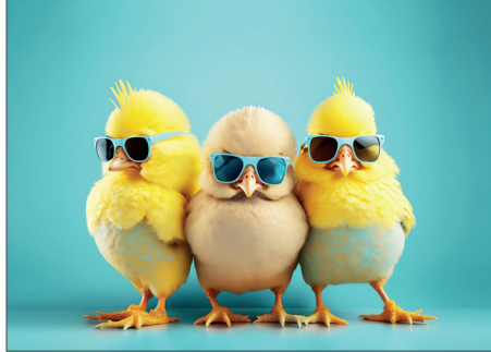
216602 Coole Küken