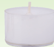
Teelicht (transparente Hülle)