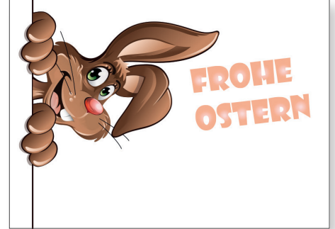
211040 Frecher Osterhase