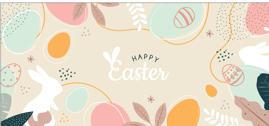
216601 Easter Boho Style